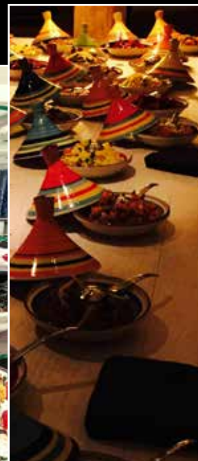
Een feest thuis