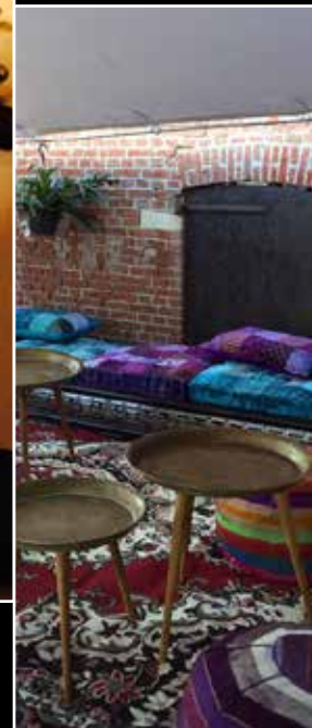
Feest op locatie